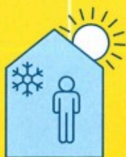
RESTEZ AU FRAIS